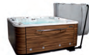
Accesorio ideal para recoger de forma cómoda la cubierta del spa