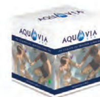
Kit de desinfección

Como parte de nuestra política de mejoramiento continuo, nos reservamos el derecho de modificar el diseño y/o especificaciones sin previo aviso.