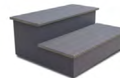
Escalera Woodermax GRAFITO (o modelo BASIC)